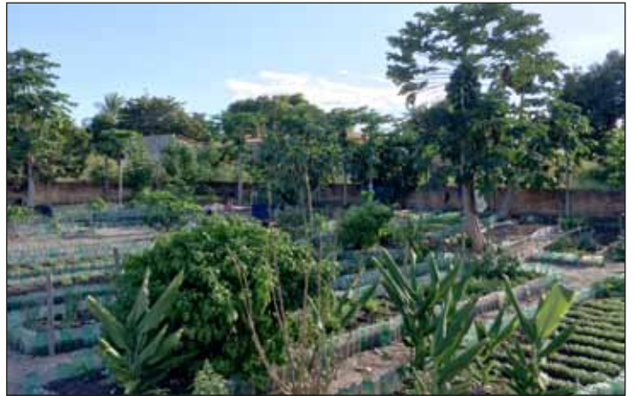
Trockenes Land wird fruchtbar durch Brunnenbau und Gartenprojekte